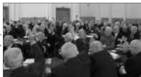
Podczas Zjazdu wybrano nowe władze ŚZZAK

Minister Janusz Krupski dziękował członkom ŚZZAK za wkład w upamiętnianie tradycji niepodległościowych.