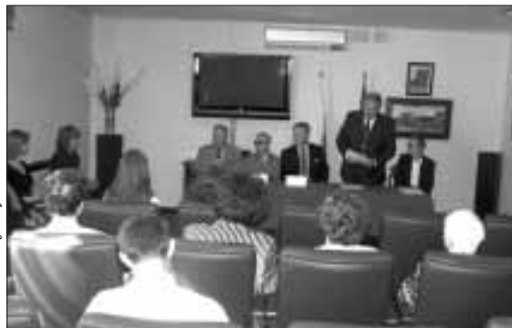
Spotkanie z Polakami w Ambasadzie RP w Kiszyniowie

Następnym miejscem spotkania z Polakami była wieś Styrca – nazywana przez wszystkich w Mołdawii polską wsią. Na początku minionego stulecia z okolic Kamieńca Podolskiego dotarli tutaj pierwsi polscy osadnicy. Kultywowali własne tradycje i styl życia. Domy wielu z nich zachowały się do dzisiaj niemal w nienaruszonym stanie. We wsi funkcjonuje Dom