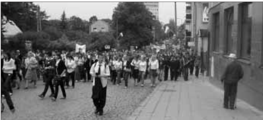
Po raz ósmy ulicami Białegostoku przemaszerował wielotysięczny tłum w Marszu Żywej Pamięci Polskiego Sybiru

i Stanów Zjednoczonych, uczniowie (w tym młodzież ze szkół noszących imię Sybiraków), przedstawiciele władz państwowych i samorządowych, formacji wojskowych i policyjnych, mieszkańcy Białegostoku.