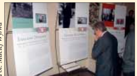
Wystawa znaczków pocztowych z wizerunkami Prezydentów RP na Uchodźstwie w Muzeum Narodowym w Warszawie