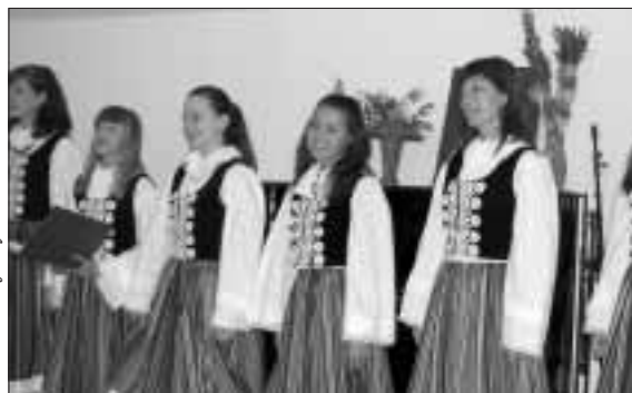
Występ zespołu polonijnego „Jaskółki” uatrakcyjnił spotkanie w Bielcach