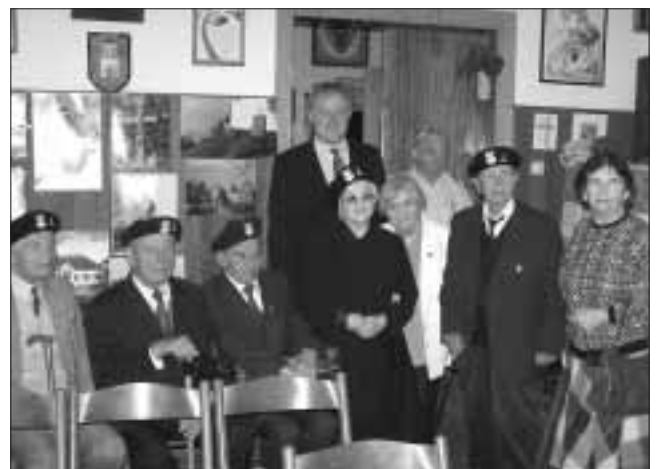
Minister Jan S. Ciechanowski z lwowskimi kombatantami