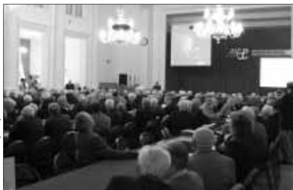
Delegaci VIII Zjazdu Światowego Związku Żołnierzy Armii Krajowej podsumowali mijającą kadencję władz

dawnictwem „Rytm” i przy dotacji Ministerstwa Obrony Narodowej, serię wydawniczą Biblioteka Armii Krajowej. Dzięki działalności Fundacji Filmowej AK realizowane są filmy poświęcone AK i innym organizacjom niepodległościowym. Wspólnie z Instytutem Pamięci Narodowej powstał warszawski Klub Historyczny im. gen. Stefana Roweckiego „Grota”. Dzisiaj takie kluby działają już